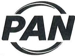
PARTIDO ACCIÓN NACIONAL

Para el ejercicio 2025, seis partidos políticos nacionales con acreditación ante el Consejo General del Instituto Electoral del Estado de Campeche fueron sujetos del financiamiento público establecido en la Ley de Instituciones y Procedimientos Electorales del Estado de Campeche, los cuales fueron: