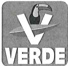
PARTIDO VERDE ECOLOGISTA DE MÉXICO