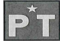
PARTIDO DEL TRABAJO